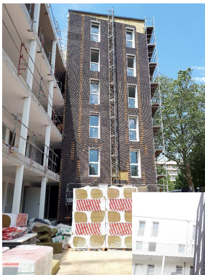
Réalisation des façades