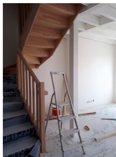
Peinture (ici dans un duplex)